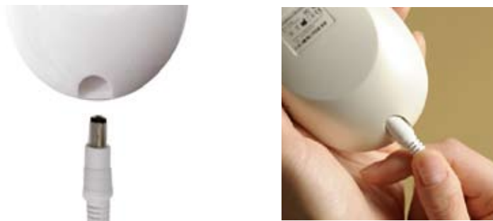
しっかり強く差し込む